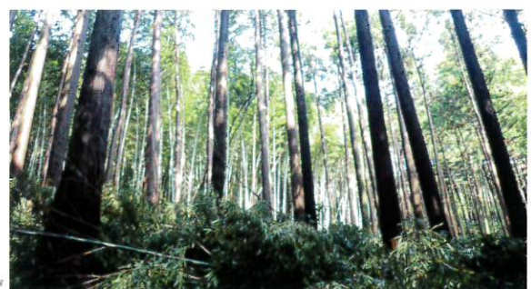
侵入竹伐採 施工後